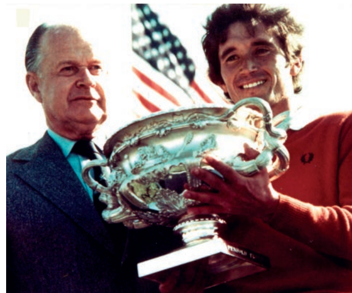
Manolo Piñero. Campeón del Mundo de Golf. California 1976. Manolo Piñero. Golf Champion. California 1976

Pero Sun Breeze no es solo localización, tanto el diseño como la construcción de su complejo residencial son el resultado de exigir siempre, un respeto por el entorno y unos altos estándares de calidad para nuestros proyectos, no solo con respecto al cuidado en el diseño, en el desarrollo o en el acabado, sino también en la elección de los materiales con los que trabajamos.